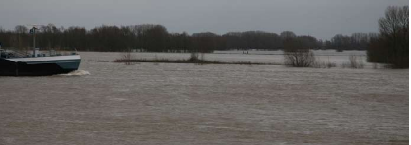
Hoogwater in de Waal

22 meter boven het polderniveau uitsteken. Dit past niet in het vlakke rivierlandschap van de Waal. Wij pleiten ervoor meer rekening te houden met de cultuurhistorische waarden van het terrein en de ligging in het unieke landschap eromheen.