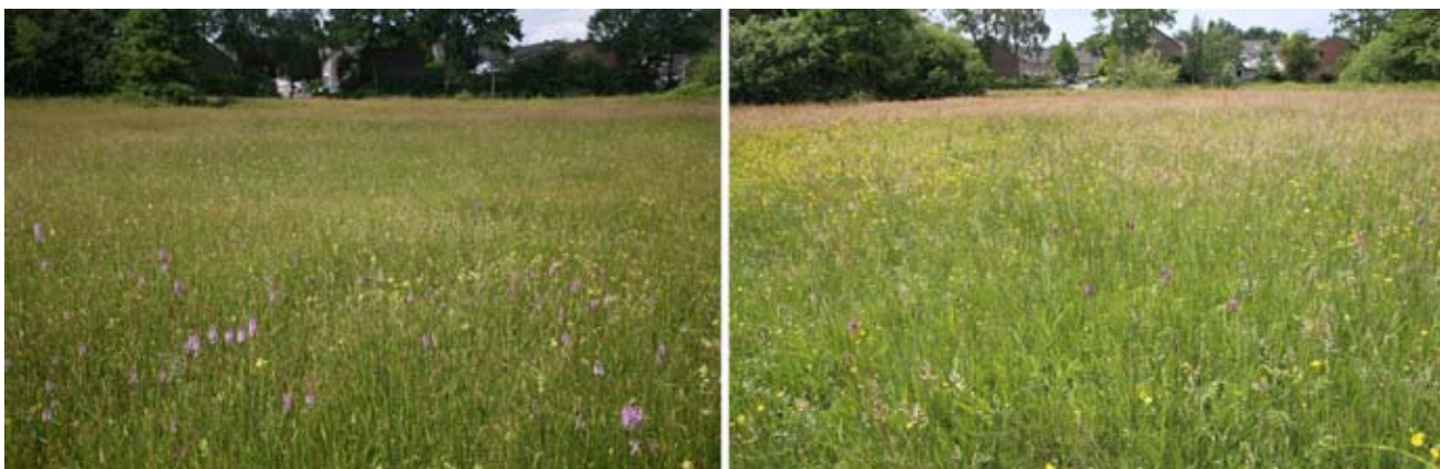
De Foeperpot 2013 links en 2020 rechts verandert sterk als gevolg van verdroging