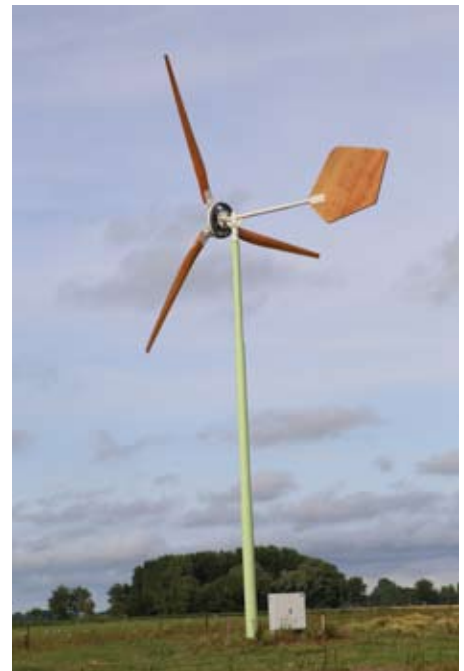
Kleinschalige landschapsvriendelijke en stille windturbine het equivalent van zonnepanelen op daken?

We zijn er een voorstander van om de mogelijkheden voor zonnepanelen op daken en gebouwen beter te benutten. We hebben de gemeente gevraagd om dit te stimuleren. En we zijn bezorgd over nieuwe initiatieven voor de plaatsing van windturbine in de gemeente of net daarbuiten, in het Reichswald.