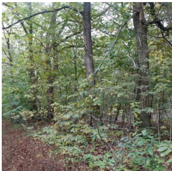
Eeuwenoude kastanjes staan in een rij op een historische wal

Er zijn vormen van landbouw die wel bijdragen aan een oplossing voor het verminderen van de CO 2 in de atmosfeer,