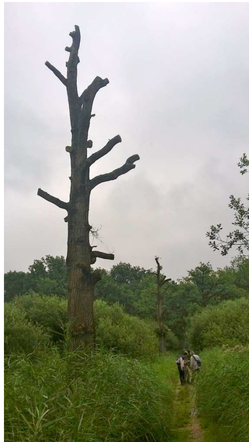
Figuur 3. Gekandelaberde dode eikenboom in De Bruuk, een mooi voorbeeld van staand dood hout. 6 augustus 2016.

met koekoeksbijen Nomada en Sphecodes eromheen. Het is waarschijnlijk dat er ook grondnesten in De Bruuk voorkomen, bijvoorbeeld langs zandpaden, greppels of slootkanten. Een leembult zoals gezien bij de excursie in augustus 2016 biedt ongetwijfeld ook een onderkomen. Voor de bovengronds nestelende soorten is het aanbod misschien wel schaarser en kwetsbaarder voor beheersmaatregelen, omdat het hier gaat om holle takken van braam en wilg, holle stengels van ruigtekruiden, rietsigaargallen en dood hout. Aangezien deze elementen grotendeels voorkomen in perceelranden (ruige zomen, rietkragen, struweel), is het verstandig deze te behouden of – mocht periodiek terugzetten nodig zijn voor de hooilanden – beheer gefaseerd uit te voeren, zelfs binnen een perceel, omdat sommige soorten zeer lokaal kunnen voorkomen. Dood hout kan men het best laten staan als het geen gevaar vormt voor bezoekers en als dat wel geval is zo hoog mogelijk afzetten zodat zoveel mogelijk van de stam bewaard blijft. Tijdens de excursie in augustus 2016 is hier een mooi voorbeeld van gezien (Fig. 3).