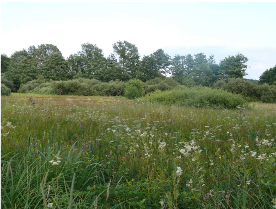
Figuur 5. Bloei in De Bruuk op 17 juli 2010, met gewone engelwortel, moerasspirea, grote wederik, kale jonker en grote kattenstaart.

Nest (gebaseerd op Peeters et al. 2004): categorieën zie Tabel 2.