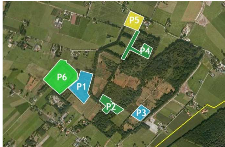
Figuur 1. Inventarisatielocaties in De Bruuk in 2010. Kaart van Google Earth.

De blauwgraslanden van De Bruuk staan voor veel bezoekers bekend om de orchideeën (Thissen 2010). Voor bijen en wespen zijn dit niet de belangrijkste voedselbronnen. Plantensoorten in de hooilanden en struwelen daaromheen volgen elkaar op in hun bloei, en zorgen voor een langdurig en gevarieerd voedselaanbod voor bijen en wespen. In Tabel 1 schets ik op basis van eigen veldwaarnemingen een beeld van het seizoensverloop in bloemaanbod.